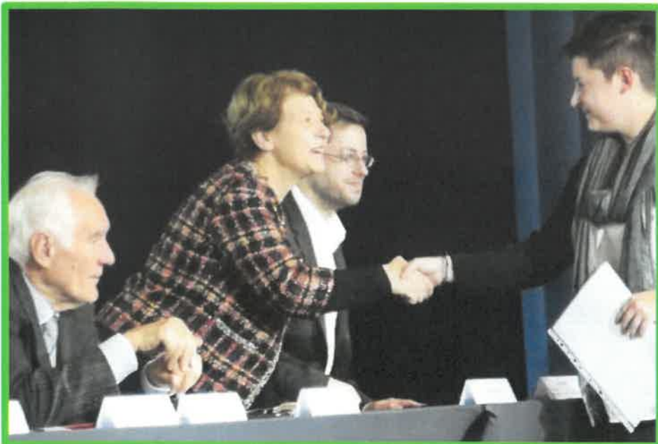
Remise des diplômes à l'ISAT de Nevers - (Institut Supérieur de l'Automobile et des Transports) - 25 novembre 2017